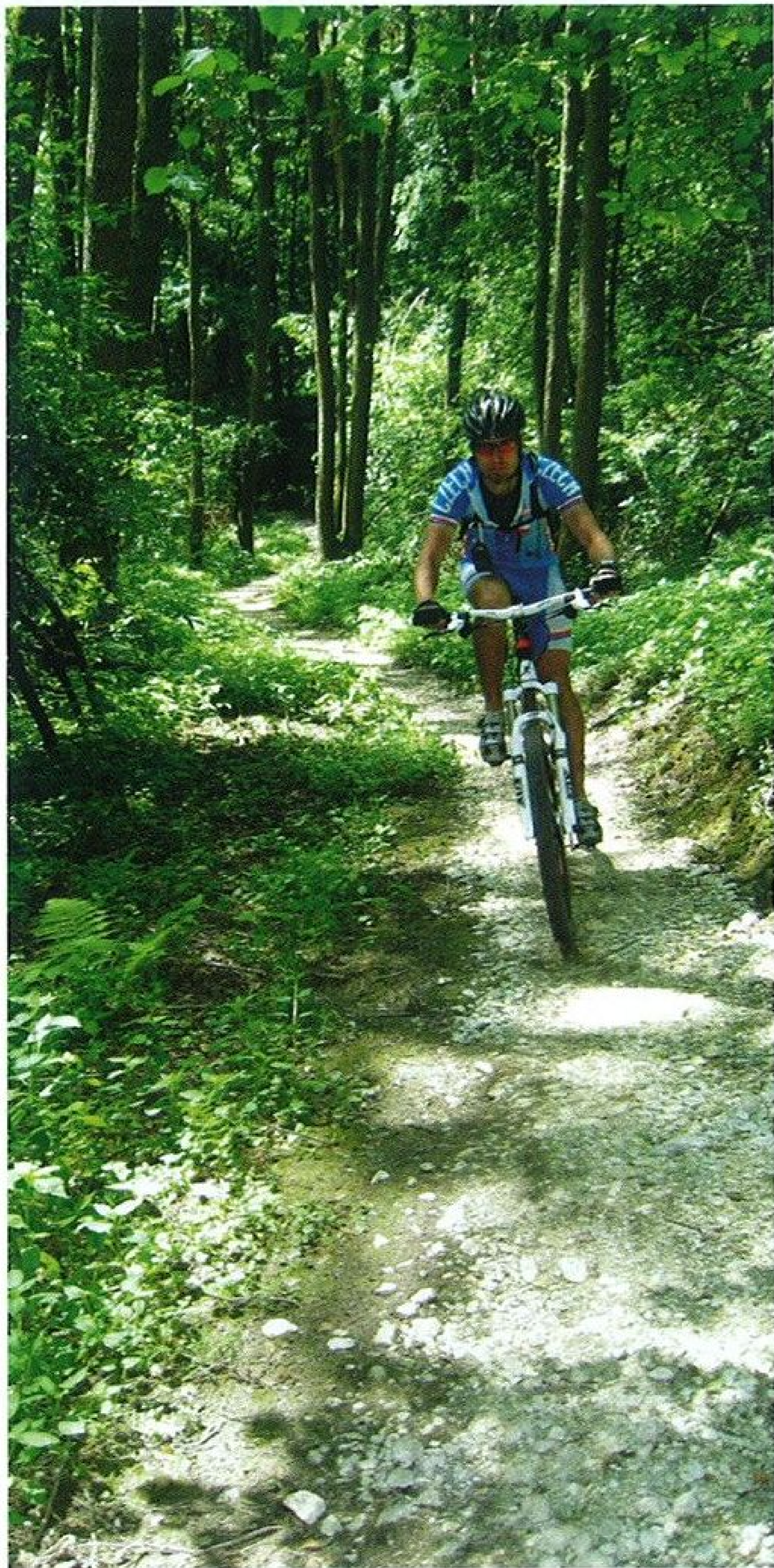
Povrch klikací se stezky je zpevněn šotolinou