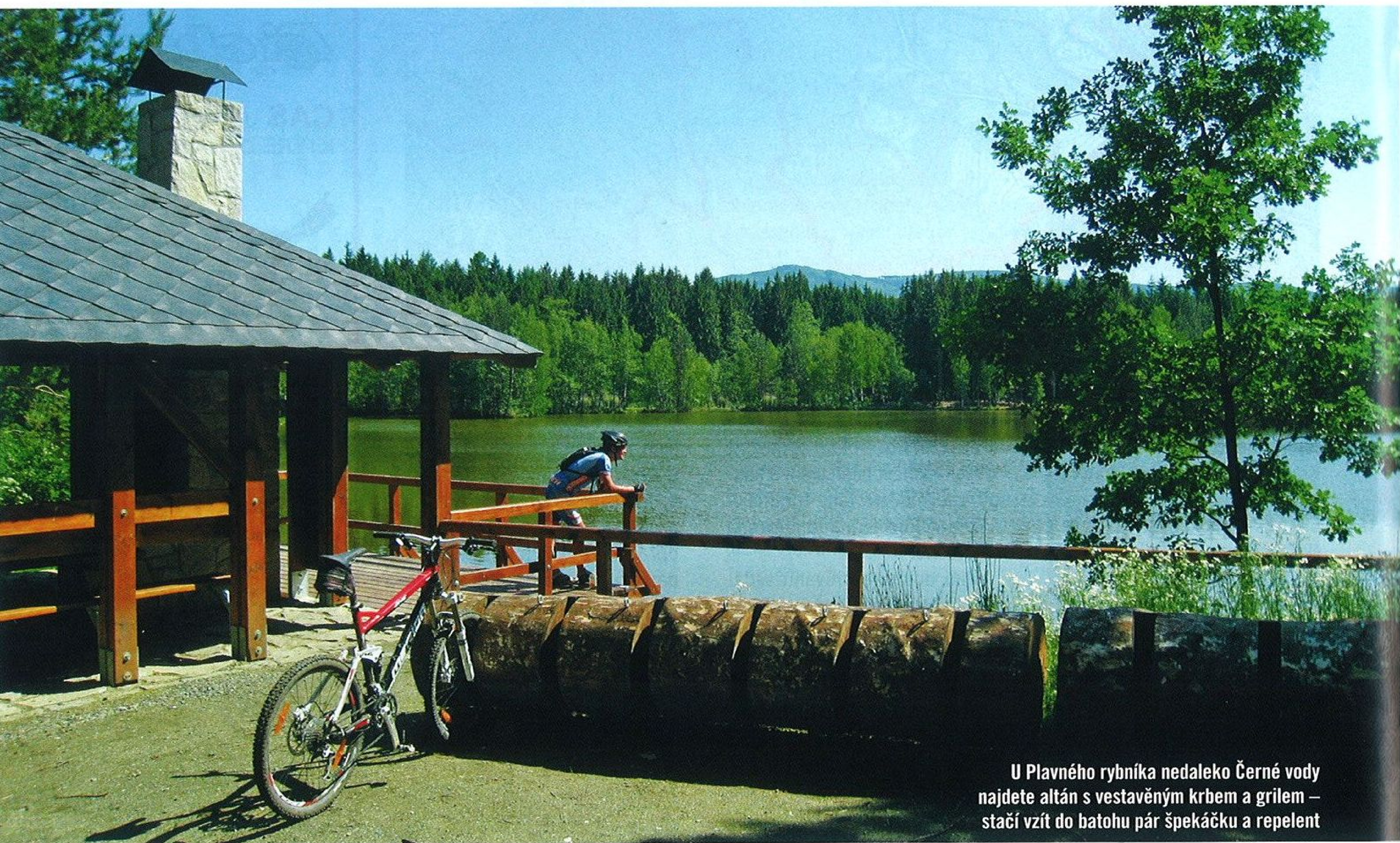
U Plavného rybníka nedaleko Černé vody najdete altán s vestavěným krbem a grilem – stačí vzít do batohu pár špekáčku a repelent

VÝŠLAP NA BORŮVKOVOU HORU MOHL NĚKOHO ODRADIT SVÝM TUČNÝM PŘEVÝŠENÍM, TO VŠAK NENÍ PŘÍPAD NAŠEHO DRUHÉHO VÝLETU. TO SE JEN POVEZEME Z MÍRNÉHO KOPEČKA, UŽIJEME SI HRAVÉHO KLIČKOVÁNÍ MEZI STROMY PODÉL POTOKA, KTERÉ ZVLÁDNE I SPORTOVNĚJŠÍ BABIČKA, POTĚŠÍME OKO VÝHLEDY NA SKALNÍ MÍSY A NAKONEC SPOČINEME U RYBNÍKA UPROSTŘED LESŮ.